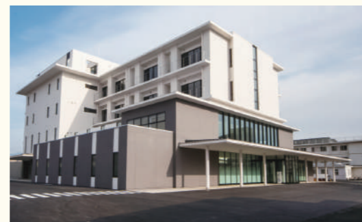
愛媛生協病院(2013年リニューアル)

私たち愛媛生協病院は、これからも発足当時の理念を忘れずに「いつでも、どこでも、誰もが、安心して受けられる地域医療」を追求してまいります。